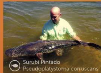
Surubi Pintado Pseudoplatystoma corruscans

Rodeada por los Ríos Paraná y Uruguay con una gran variedad de peces y el marco ideal para las diferentes modalidades de pesca deportivas La Provincia de Corrientes es un verdadero paraíso para el pescador!