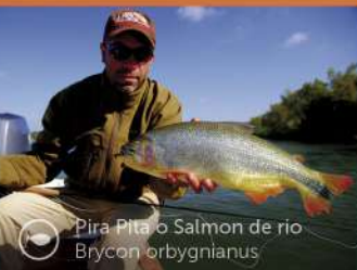
Pira Pita o Salmon de río Brycon orbygnianus

Avenida Costanera 99 (+54) 379 4 231245 www.corrientes.gob.ar