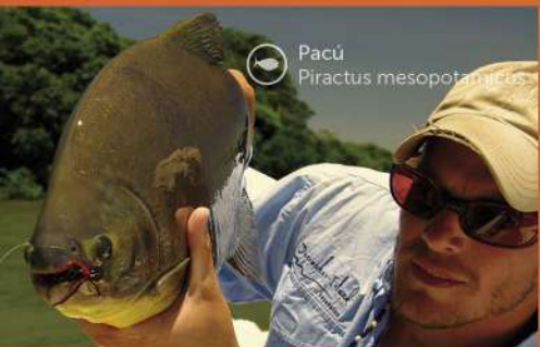
Pacu Piractus mesopotamicus

Rodeada por los Ríos Paraná y Uruguay con una gran variedad de peces y el marco ideal para las diferentes modalidades de pesca deportivas La Provincia de Corrientes es un verdadero paraíso para el pescador!