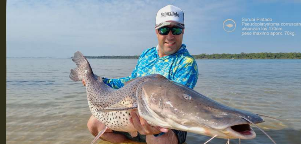
Surubi Pintado Pseudoplatystoma corruscans alcanzan los 170cm peso máximo aprox. 70kg

En sus aguas se encuentran un gran número de especies, muchas de las cuales son codiciadas por los expertos pescadores como: el pacu , la boga , el surubi y el dorado . Estos dos últimos son los peces que captan el mayor interés por los aficionados a la pesca de todo el mundo, ya que se destacan por su gran porte e inigualable fuerza y espíritu de lucha . Pero el más valioso trofeo que esconden nuestras aguas es sin lugar a dudas, el dorado o tigre del río , que por su incomparable belleza, sus saltos acrobáticos durante la pelea y astucia para liberarse de los anzuelos hacen que su captura sea un gran desafío.