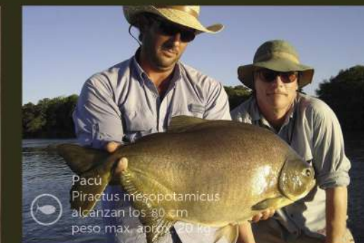
Pacu Piractus mesopotamicus alcanzan los 80 cm peso max. aprox. 20 kg