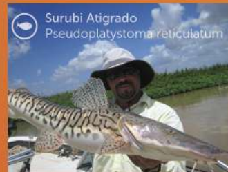
Surubi Atigrado Pseudoplatystoma reticulatum