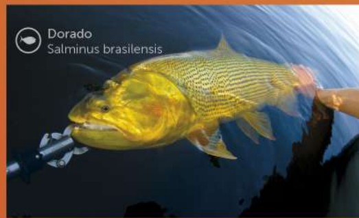
Dorado Salminus brasiliensis